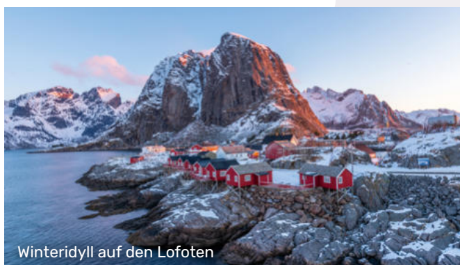
Winteridyll auf den Lofoten